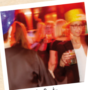
Party, Party, Party

Unser Mitarbeiterfest war ein voller Erfolg! Das Ambiente war einfach großartig und hat die perfekte Atmosphäre für eine unvergessliche Feier geschaffen. Das Essen und die Getränke waren köstlich und haben uns alle begeistert. Mit einem DJ und Tanz haben wir die Nacht durchgemacht und jede Menge Spaß gehabt. Es war wirklich ein gelungenes Fest. Unsere Mitarbeiter sind die Besten!